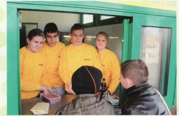
Schüler managen den Schulkiosk